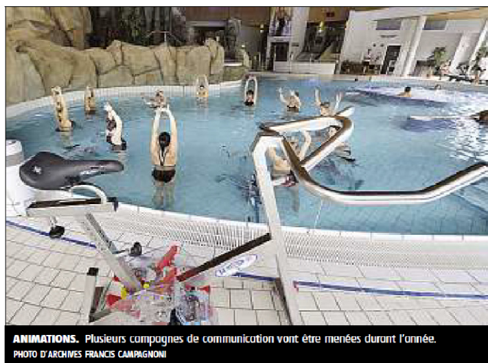
ANIMATIONS. Plusieurs campagnes de communication vont être menées durant l'année.

« Cette année sera entre autres consacrée à mettre noir sur blanc un programme pluriannuel d'investissements pour une éventuelle extension ». Les projets ne manquent pas au premier rang desquels figure donc « un nouveau bassin couvert de 100 m 2 » qui pourrait permettre si